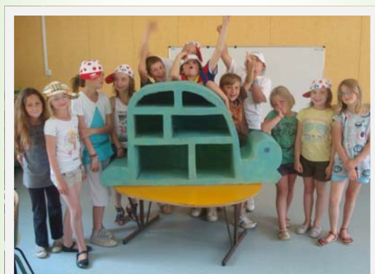
Création collective, une bibliothèque pour le centre.