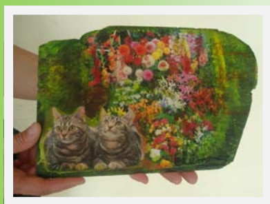
Création d'une animatrice.

de vieilles ardoises pour faire des tableaux à Rânes, ou des cartons pour fabriquer des meubles à Trun.