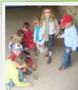
Une animation a permis de découvrir :