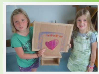
Création individuelle en carton.